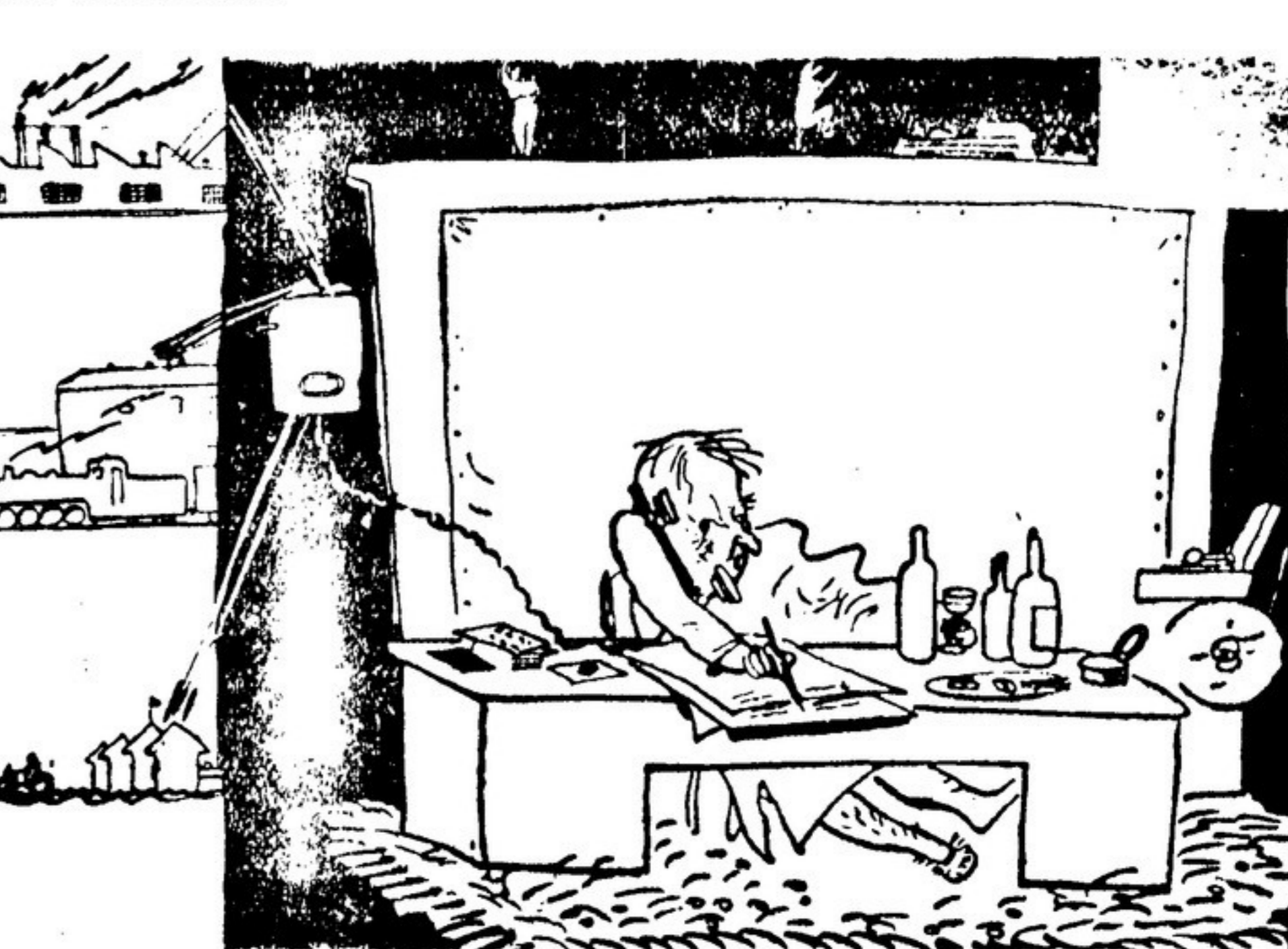
«СВЯЗЬ ПОЭТА С ДЕЙСТВИТЕЛЬНОСТЬЮ».